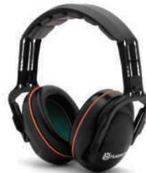
PROTECTOR AURICULAR 505 66 53-04