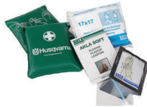
KIT DE PRIMEROS AUXILIOS 504 09 53-01