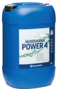
GASOLINA XP® POWER 4T 583 95 59-02