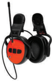
AURICULARES PARA CASCOS CON RADIO FM 578 27 49-04