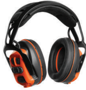
PROTECTORES AURICULARES X-COM R 595 08 40-01