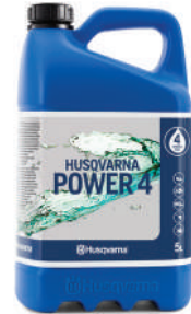
GASOLINA XP® POWER 4T 583 95 59-01