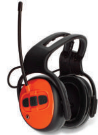
PROTECTOR AURICULAR CON RADIO FM 578 27 49-03