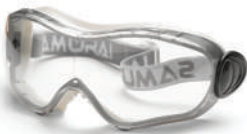
GAFAS DE PROTECCIÓN, GOGGLES 544 96 39-01