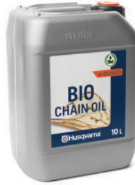
ACEITE CADENA HUSQVARNA X-GUARD BIO 596 45 73-03