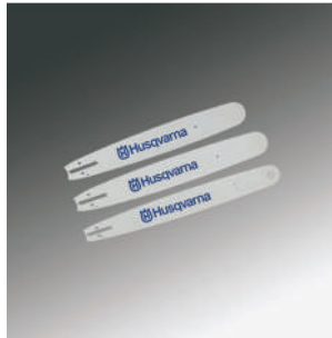
BARRAS ESPECIALES 501 82 85-40