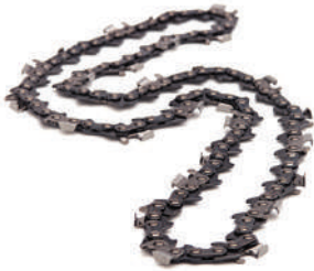
CADENA CORTADA H00 64 ESLABONES 501 84 40-64