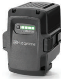
HUSQVARNA BATERÍA BLI200 967 09 19-01