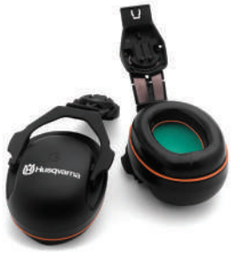
AURICULARES PARA CASCOS 505 66 53-25