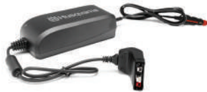
HUSQVARNA CARGADOR QC80F 967 62 83-01