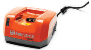
CARGADOR DE BATERÍA QC330 HUSQVARNA 967 09 14-01