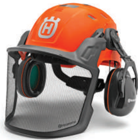
CASCO FORESTAL, TECHNICAL 585 05 84-01