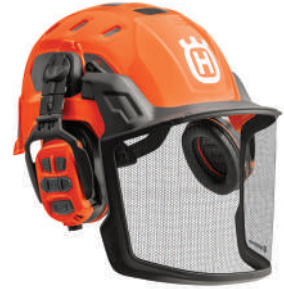
X-COM R TECHNICAL FOREST HELMET 595 08 43-01