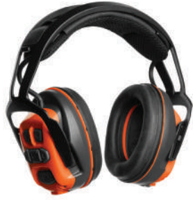
PROTECTORES AURICULARES X-COM R 595 08 40-01