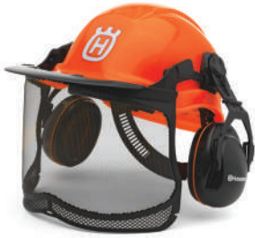
CASCO FORESTAL, FUNCTIONAL 576 41 24-02