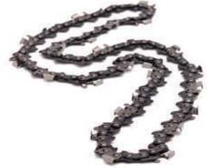
CADENA CORTADA H00 58 ESLABONES 501 84 40-58