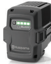
HUSQVARNA BATERÍA BLI300 967 07 19-01