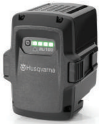
HUSQVARNA BATERÍA BLI100 967 09 18-01