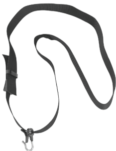
ARNÉS DIAGONAL 537 21 62-01