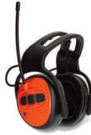
PROTECTOR AURICULAR CON RADIO FM 578 27 49-03