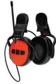
AURICULARES PARA CASCOS CON RADIO FM 578 27 49-04