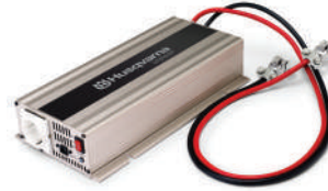
HUSQVARNA CONVERTOR DE TENSIÓN V1600F 967 62 85-01