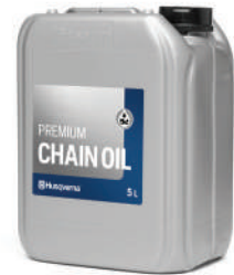
ACEITE DE CADENA MINERAL 579 39 61-01