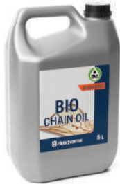
ACEITE CADENA HUSQVARNA X-GUARD BIO 596 45 73-02