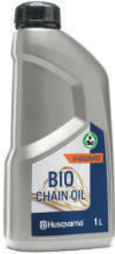
ACEITE CADENA HUSQVARNA X-GUARD BIO 596 45 73-01