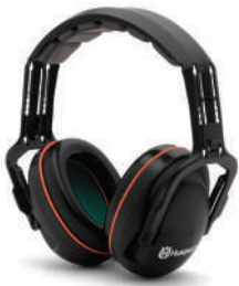
PROTECTOR AURICULAR 505 66 53-04