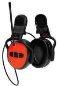
AURICULARES PARA CASCOS CON RADIO FM 578 27 49-04