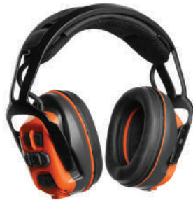
PROTECTORES AURICULARES X-COM R 595 08 40-01