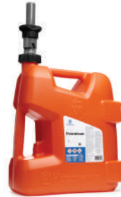
BIDÓN COMBUSTIBLE 580 75 45-01