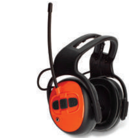
PROTECTOR AURICULAR CON RADIO FM 578 27 49-03