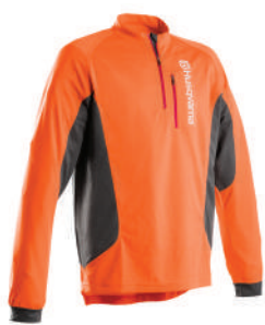
CAMISA TECHNICAL MANGA LARGA 50172 03-62