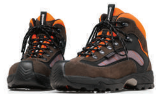
BOTAS DE PROTECCIÓN, TECHNICAL 575 35 47-38