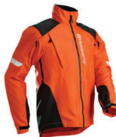
CHAQUETA PARA DESBROCE, TECHNICAL 580 68 82-54