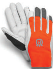
GUANTES, CLASSIC LIGHT 596 31 06-10