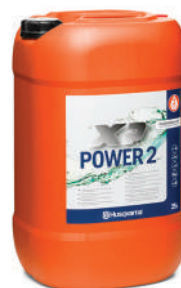
GASOLINA XP® POWER 2T 583 95 29-02