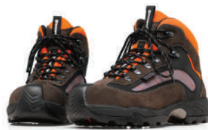
BOTAS DE PROTECCIÓN, TECHNICAL 575 35 47-36