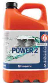
GASOLINA XP® POWER 2T 583 95 29-01