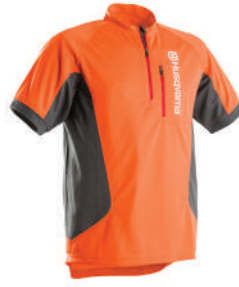
CAMISA TECHNICAL MANGA CORTA 501 71 59-58