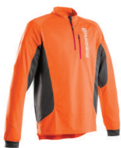
CAMISA TECHNICAL MANGA LARGA 50172 03-46