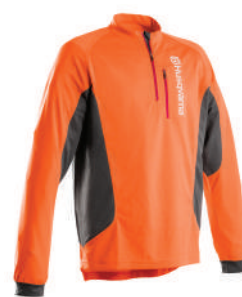
CAMISA TECHNICAL MANGA LARGA 50172 03-54