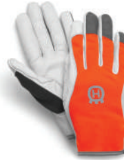
GUANTES, CLASSIC LIGHT 579 38 00-08