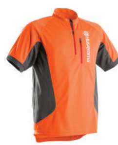
CAMISA TECHNICAL MANGA CORTA 50171 59-46