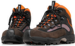
BOTAS DE PROTECCIÓN, TECHNICAL 575 35 47-43