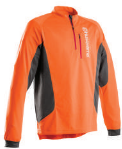
CAMISA TECHNICAL MANGA LARGA 50172 03-58