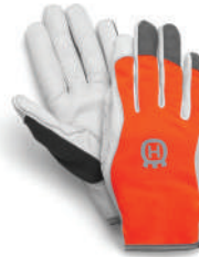
GUANTES, CLASSIC LIGHT 596 31 06-08