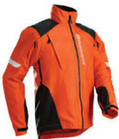
CHAQUETA PARA DESBROCE, TECHNICAL 580 68 82-46