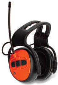
PROTECTOR AURICULAR CON RADIO FM 578 27 49-03