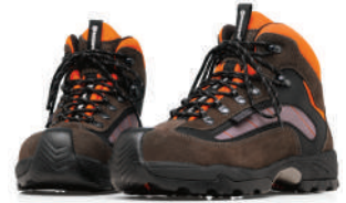
BOTAS DE PROTECCIÓN, TECHNICAL 575 35 47-46