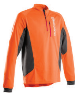
CAMISETA TECHNICAL MANGA LARGA 50172 03-66