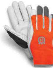
GUANTES, CLASSIC LIGHT 596 31 06-09