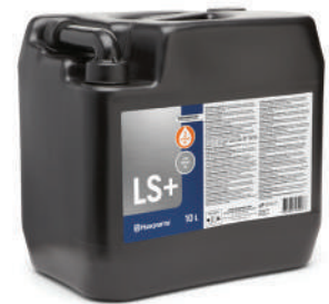
ACEITE DE 2 TIEMPO LS+ 578 18 00-02