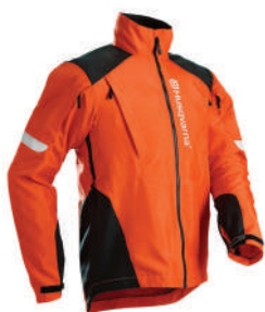
CHAQUETA PARA DESBROCE, TECHNICAL 580 68 82-62