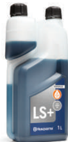
ACEITE DE 2 TIEMPO LS+ 578 03 70-02