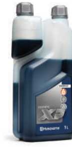
ACEITE DE DOS TIEMPOS XP® SINTÉTICO 578 03 70-03