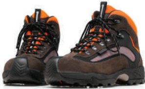
BOTAS DE PROTECCIÓN, TECHNICAL 575 35 47-47