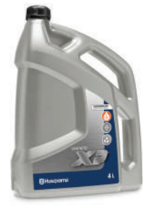
ACEITE DE DOS TIEMPOS XP® SINTÉTICO 578 03 71-03