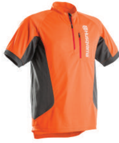
CAMISA TECHNICAL MANGA CORTA 501 71 59-54