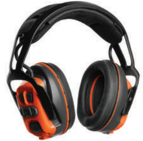
PROTECTORES AURICULARES X-COM R 595 08 40-01