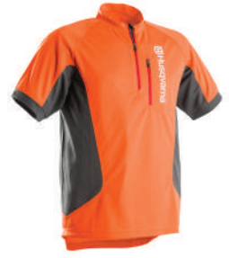
CAMISA TECHNICAL MANGA CORTA 501 71 59-62