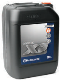
ACEITE DE DOS TIEMPOS XP® SINTÉTICO 578 18 00-03