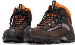
BOTAS DE PROTECCIÓN, TECHNICAL 575 35 47-40