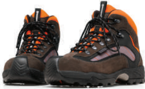
BOTAS DE PROTECCIÓN, TECHNICAL 575 35 47-39