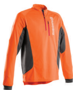
CAMISA TECHNICAL MANGA LARGA 50172 03-50