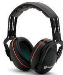
PROTECTOR AURICULAR 505 66 53-04