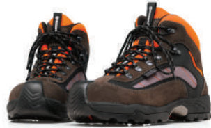
BOTAS DE PROTECCIÓN, TECHNICAL 575 35 47-44