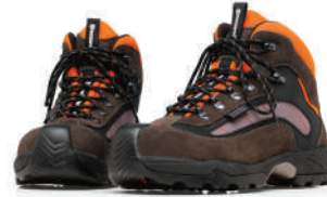
BOTAS DE PROTECCIÓN, TECHNICAL 575 35 47-41