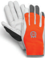
GUANTES, CLASSIC LIGHT 596 31 06-06