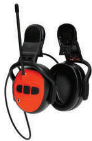
AURICULARES PARA CASCOS CON RADIO FM 578 27 49-04