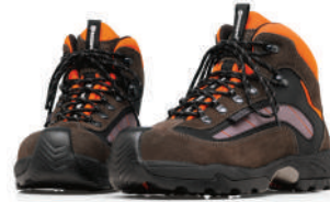
BOTAS DE PROTECCIÓN, TECHNICAL 575 35 47-45