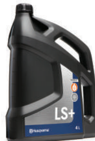
ACEITE DE 2 TIEMPO LS+ 578 03 71-02