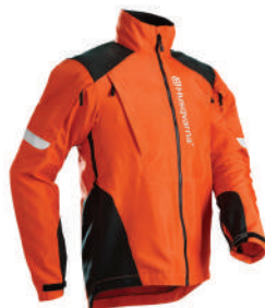
CHAQUETA PARA DESBROCE, TECHNICAL 580 68 82-50