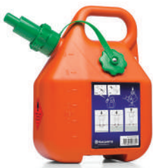
BIDÓN DE GASOLINA DE 6 L, NARANJA 505 69 80-01