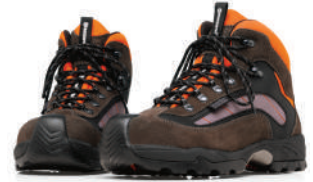
BOTAS DE PROTECCIÓN, TECHNICAL 575 35 47-42