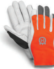
GUANTES, CLASSIC LIGHT 579 38 00-10