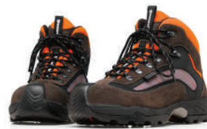
BOTAS DE PROTECCIÓN, TECHNICAL 575 35 47-37