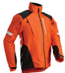
CHAQUETA PARA DESBROCE, TECHNICAL 580 68 82-58