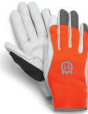
GUANTES, CLASSIC LIGHT 596 31 06-07