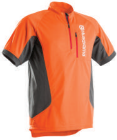
WORK T-SHIRT SHORT SLEEVE, TECHNICAL 501 71 59-66