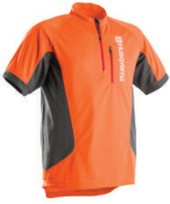
CAMISA TECHNICAL MANGA CORTA 501 71 59-50