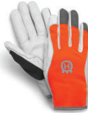
GUANTES, CLASSIC LIGHT 579 38 00-07