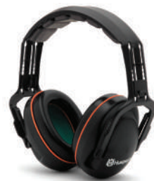
PROTECTOR AURICULAR 505 66 53-04