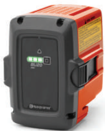
HUSQVARNA BATERÍA BLI20 967 09 17-01