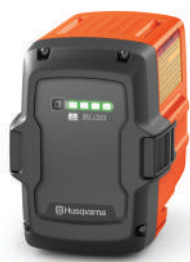
HUSQVARNA BATERÍA BLI30 967 93 77-01