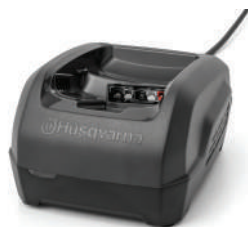
HUSQVARNA CARGADOR QC250 967 97 01-01