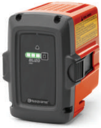
HUSQVARNA BATERÍA BLI20 967 09 17-01