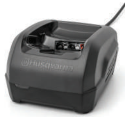
HUSQVARNA CARGADOR QC250 967 97 01-01