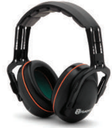
PROTECTOR AURICULAR 505 66 53-04