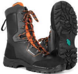
BOTAS SEGURIDAD CLASSIC 20 597 65 94-40