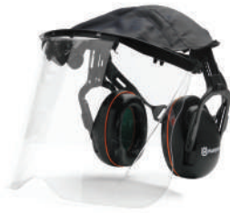
PROTECTOR AURICULAR CON PLEXIVISOR 505 66 53-48