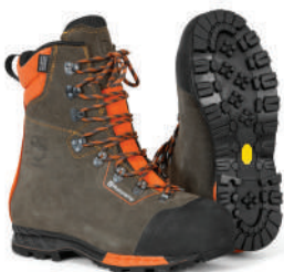
BOTAS DE PIEL FUNCIONAL 24 597 65 93-44