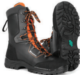
BOTAS SEGURIDAD CLASSIC 20 597 65 94-45