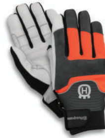
GUANTES, TECHNICAL CON PROTECCIÓN ANTICORTE 595 00 34-08