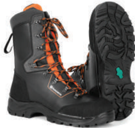
BOTAS SEGURIDAD CLASSIC 20 597 65 94-41