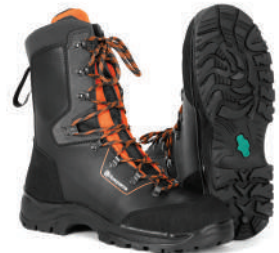
BOTAS SEGURIDAD CLASSIC 20 597 65 94-47