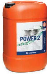
GASOLINA XP® POWER 2T 583 95 29-02