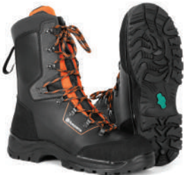
BOTAS SEGURIDAD CLASSIC 20 597 65 94-44