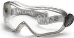
GAFAS DE PROTECCIÓN, GOGGLES 544 96 39-01