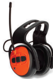
PROTECTOR AURICULAR CON RADIO FM 578 27 49-03