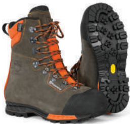
BOTAS DE PIEL FUNCIONAL 24 597 65 93-40