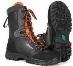
BOTAS SEGURIDAD CLASSIC 20 597 65 94-43