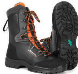
BOTAS SEGURIDAD CLASSIC 20 597 65 94-46