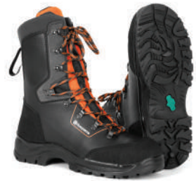
BOTAS SEGURIDAD CLASSIC 20 597 65 94-39