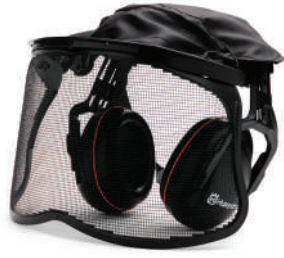
PROTECTOR AURICULAR CON VISOR DE RED 505 66 53-58