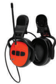
AURICULARES PARA CASCOS CON RADIO FM 578 27 49-04