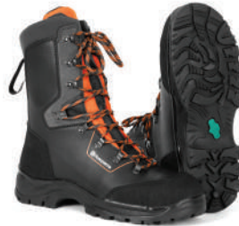
BOTAS SEGURIDAD CLASSIC 20 597 65 94-42