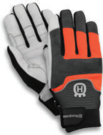
GUANTES, TECHNICAL CON PROTECCIÓN ANTICORTE 595 00 34-10