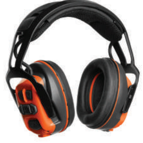
PROTECTORES AURICULARES X-COM R 595 08 40-01