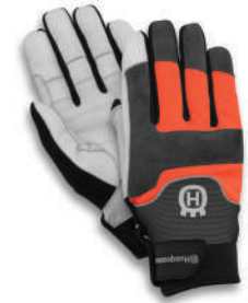
GUANTES, TECHNICAL CON PROTECCIÓN ANTICORTE 595 00 34-09