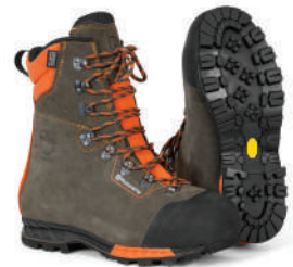
BOTAS DE PIEL FUNCIONAL 24 597 65 93-41