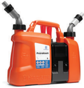
BIDÓN COMBI 5 LITROS 580 75 42-01