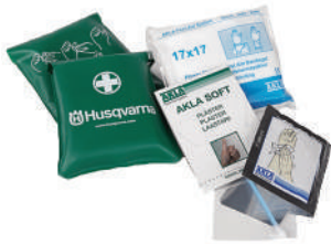
KIT DE PRIMEROS AUXILIOS 504 09 53-01