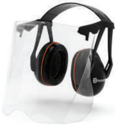
PROTECTOR AURICULAR CON VISOR 505 66 53-60