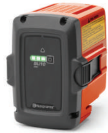
HUSQVARNA BATERÍA BLI10 967 09 16-01