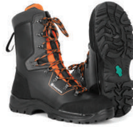
BOTAS SEGURIDAD CLASSIC 20 597 65 94-47