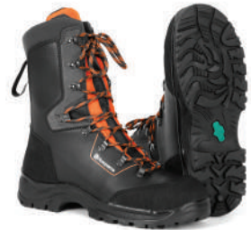
BOTAS SEGURIDAD CLASSIC 20 597 65 94-40