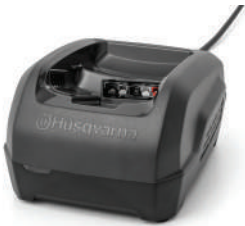
HUSQVARNA CARGADOR QC250 967 97 01-01