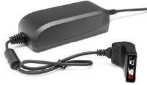
HUSQVARNA CARGADOR QC80 967 33 56-31