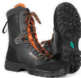
BOTAS SEGURIDAD CLASSIC 20 597 65 94-42