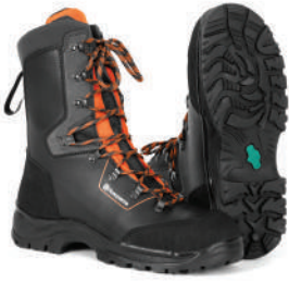
BOTAS SEGURIDAD CLASSIC 20 597 65 94-45