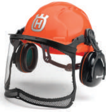
CASCO FORESTAL, CLASSIC 580 75 43-01