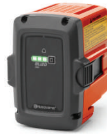
HUSQVARNA BATERÍA BLI20 967 09 17-01