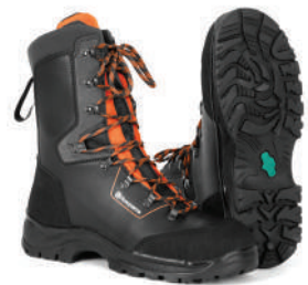
BOTAS SEGURIDAD CLASSIC 20 597 65 94-44