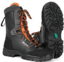
BOTAS SEGURIDAD CLASSIC 20 597 65 94-41