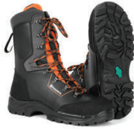
BOTAS SEGURIDAD CLASSIC 20 597 65 94-46