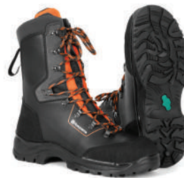
BOTAS SEGURIDAD CLASSIC 20 597 65 94-43