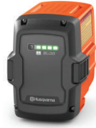
HUSQVARNA BATERÍA BLI30 967 93 77-01