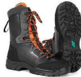
BOTAS SEGURIDAD CLASSIC 20 597 65 94-39