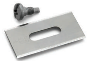
CUCHILLAS ENDURANCE AUTOMOWER® 595 08 44-01