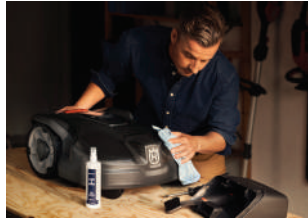
KIT DE MANTENIMIENTO Y LIMPIEZA 590 85 51-01