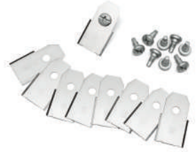
CUCHILLAS AUTOMOWER® 577 86 46-03