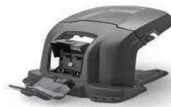
CASETA AUTOMOWER® 587 23 61-01