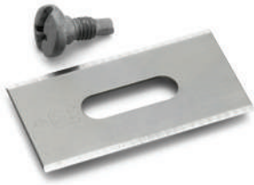
CUCHILLAS ENDURANCE AUTOMOWER® 595 08 44-02