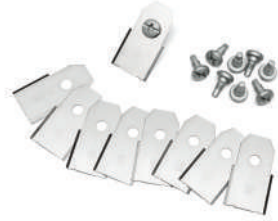
CUCHILLAS AUTOMOWER® 577 60 65-05