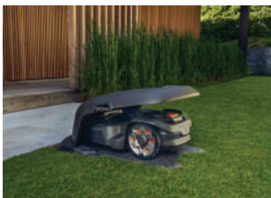
CASETA PARA ROBOT CORTACÉSPED ASPIRE™ R4 536 66 18-01