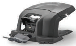
CASETA AUTOMOWER® 585 01 94-01