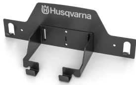
SOPORTE DE FIJACIÓN MURAL 585 01 97-02