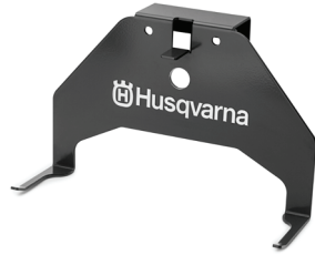
SOPORTE DE FIJACIÓN MURAL 587 22 40-01